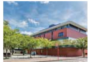
오시카 (小鹿) 캠퍼스