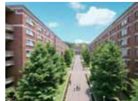
구사나기 (草薙) 캠퍼스

버스 버스 시즈테쓰버스(静鉄 BUS) JR '시즈오카역(静岡駅)' (북쪽 출구 8번 승강장) 에서 '미와오야선(美和大谷線)' (시즈오카대학=静岡大学 또는 히가시오야=東大谷方面) 으로 '오시카교쿠마에(小鹿局前)' 하차, 도보 3분 JR '시즈오카역(静岡駅)' (남쪽 출구 21번 승강장) 에서 '미나미선=南線(외선 순환)' 으로 '오시카교쿠마(小鹿局前)' 에 하차, 도보 3분