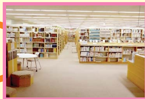
静岡県立大学短期大学部附属図書館 静岡県立大学附属図書館 小鹿図書館