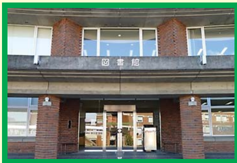
静岡県立大学附属図書館 谷田図書館